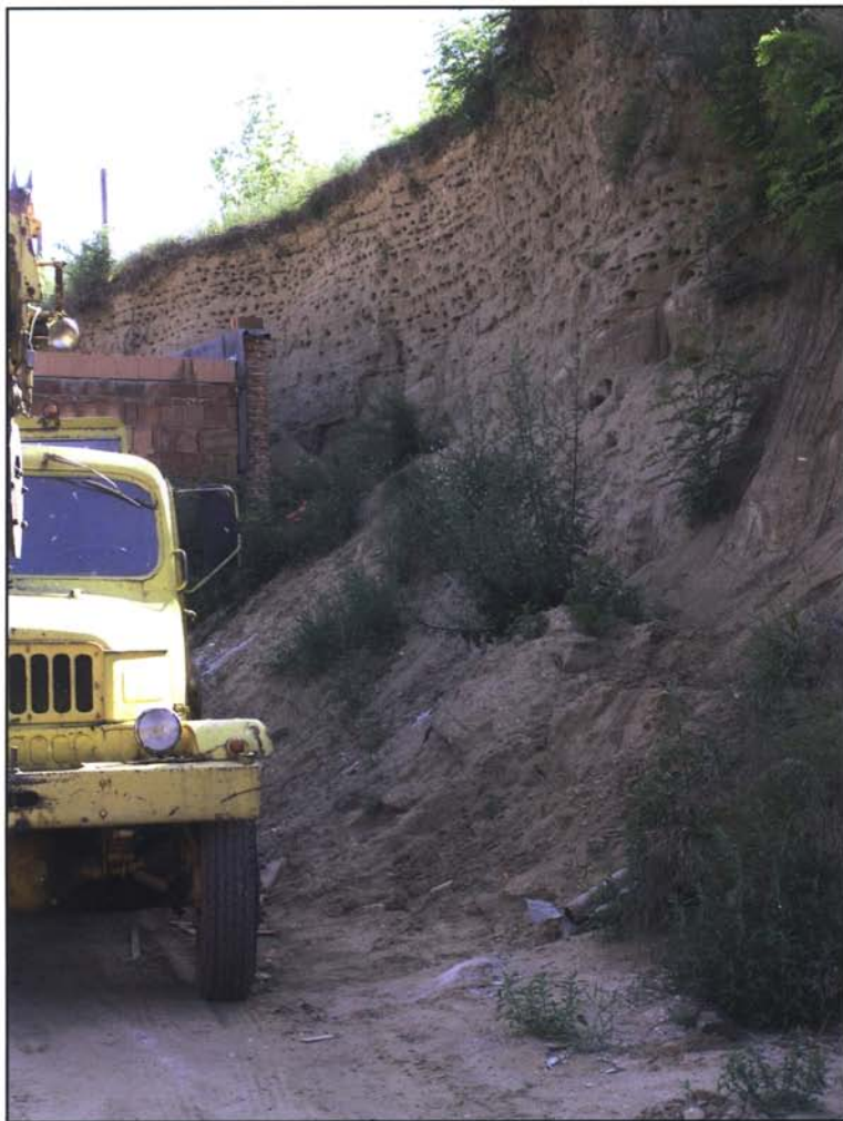
Obr. 5: Hnízdiště břehule říční ve stěně vzniklé při výkopech základů pro novostavbu ve Strachotíně (BV). 3.7.2004 (k článku na str. 3).

Fig. 5: Breeding site of the Sand Martin in the face of foundation excavations in Strachotín (BV). 3 rd July 2004 (see page 3).