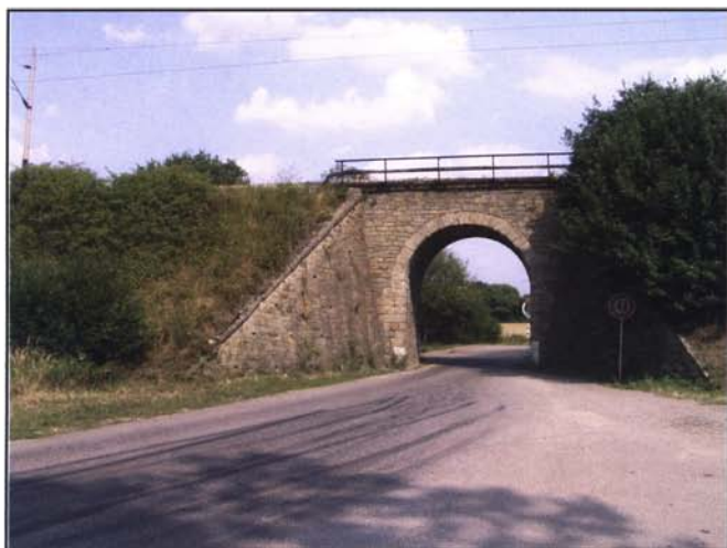
Obr. 7: Hnízdiště břehulí říčních v otvorech železničního mostu u Klenovic (TA). 5.8.2003. (k článku na str. 3).

Fig. 6: Chateau bridge in Blatná. Numerous colony of the Sand Martins breeds in the fissures of the brickwork. 5 th August 2003 (see page 3).