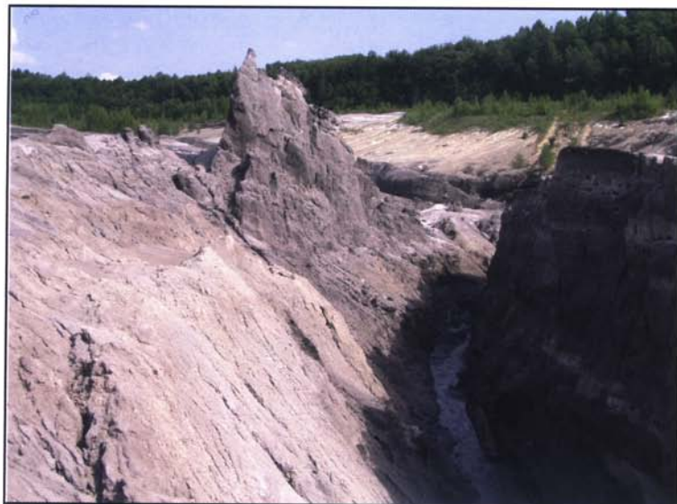
Obr. 3 a 4: Hnízdiště břehulí říčních na erodované výsypce dolu Silvestr u Sokolova (SO). 6.8.2004 (k článku na str. 3).

Fig. 3 and 4: Breeding site of the Sand Martin on an eroded spoil bank of Silvestr mine near Sokolov (SO). 6 th August 2004 (see page 3).