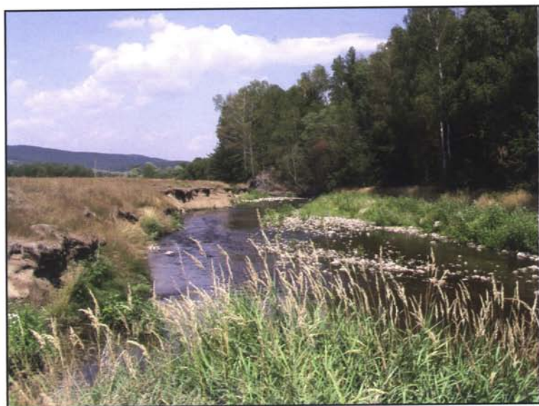
Obr. 1 a 2: Hnízdiště břehulí říčních na Litavce u Pičínského mlýna (PB), 4.7.2004 (k článku na str. 3).

Fig. 1 and 2: Breeding site of the Sand Martin on Litavka river near Pičínský mlýn (PB), 4 th July 2004 (see page 3).