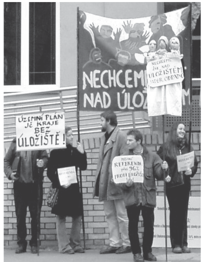
Zástupci občanů a samospráv z dotčených jihočeských oblastí nechtějí úložiště ani v územním plánu kraje.